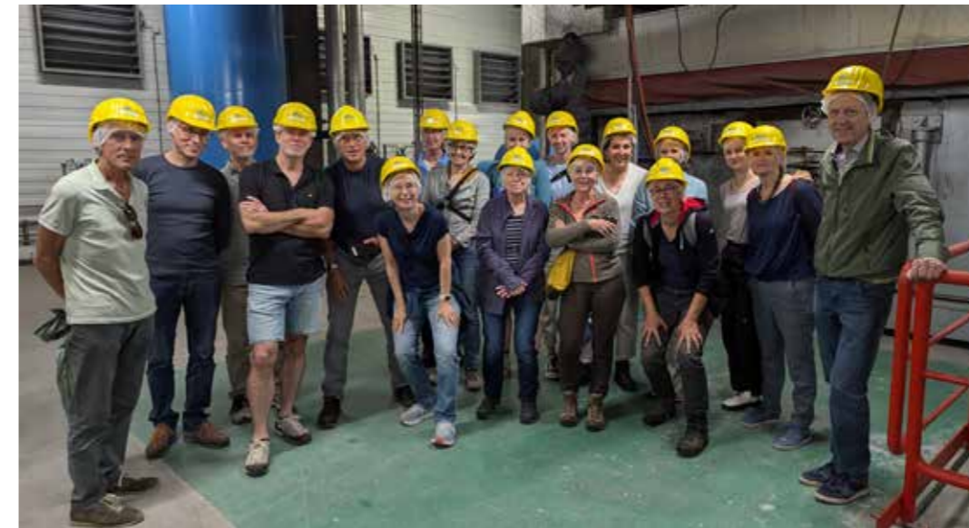
de wijkhelden bij de ARN

Voor zowel plastic als metaal geldt: alleen verpakkingen horen bij het PMD, dus geen andere plastic dingen. Spuitbussen, koffiecapsules, piepschuim en plastic netjes mogen er niet in omdat ze moeilijk te recyclen zijn. Ook medisch afval, verfblikken en verpakkingen met chemisch afval moeten bij het restafval. Maak de verpakking leeg voordat je hem in de PMD zak stopt. Als het PMD afval 'zuiver' is krijgen gemeentes er geld voor. Als het afval wordt afgekeurd draait de gemeente zelf op voor de verbrandingskosten. Dat wordt dan uiteraard weer verrekend met de afvalstoffenheffing. Drie vragen dus: Is het een verpakking? Is het leeg? Komt het uit keuken of badkamer? Is het antwoord op alle drie de vragen 'ja', dat mag het in de PMD-zak.