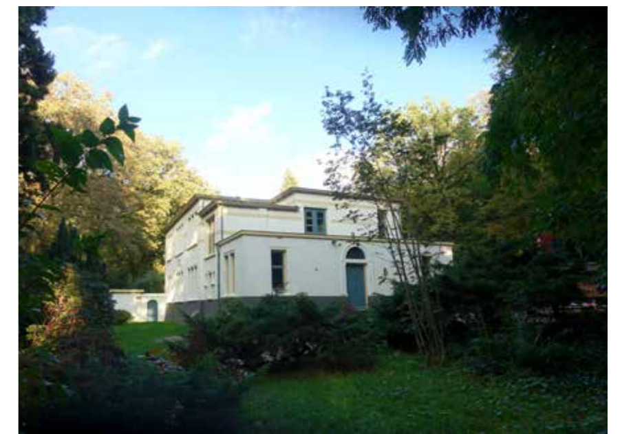
gebouw Stella Matutina aan de Mgr. Suyslaan