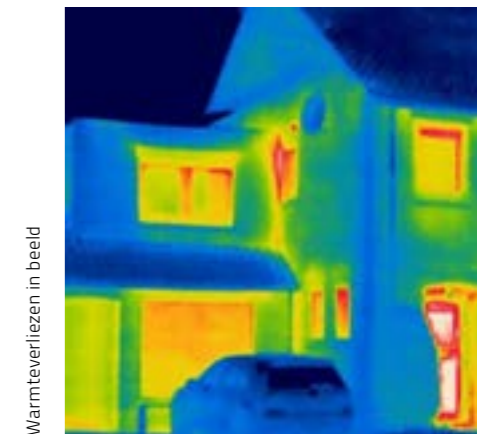
.Warmteverliezen in beeld

Na de opstart van de energiewerkplaats willen we verder met een verkenning van de mogelijkheden van een energiebedrijf, zoals de productie en opslag van (elektrische) energie, energie delen en de ontwikkeling van een pilot voor een lage temperatuur warmtenet. Tegelijkertijd pakt onze stichting de Bosduivel de verduurzaming van ons dorpshuis aan, een uniek demonstratieproject voor ons dorp.