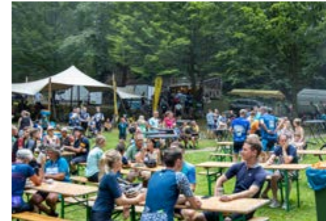
Een gezellige sfeer op het start/finissterrein.

Graag tot ziens op 27 juni en/of 7 juli!