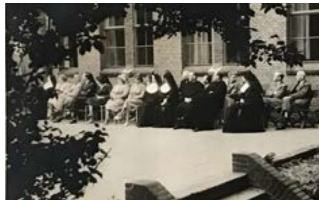
1. Een bloedhekel aan nonnen

“Na de oorlog werkte mijn vader in Nijmegen aan de wederopbouw, terwijl wij -mijn broer en ik- nog bij mijn moeder in Alkmaar woonden. Mijn zus woonde ook in Nijmegen, samen met mijn vader in een pension. Pas in 1949, ik was toen 11, konden we via een vierhoeksruil in de Ploeg een huis krijgen aan de Nijmeegsebaan. Maar daags voor dat we in dat huis konden trekken werd het gekraakt. We moesten toen eerst wachtmeester Van den Berg optrommelen