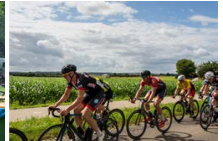
ook de recreatieve wielrenner kan genieten van de mooie omgeving.