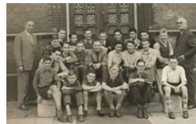
3. 2de klas Rijks-HBS

In de laatste klas van de lagere school zat ik bij de Filles de la Sagesse, de grijze nonnen aan de Groesbeekseweg, maar dat beviel me helemaal niet. Ik heb blijkbaar iets tegen nonnen! Ook na de lagere school bij de nonnen van Mater Dei op het gym vond ik het vreselijk. En al helemaal allergisch voor nonnen werd ik toen ik erachter kwam dat de werknonnen “soeur” werden genoemd en de docentnonnen “mère”. Later op de Rijks-HBS aan de Kronenburgersingel was het een stuk leuker; we zaten daar met 13 meisjes